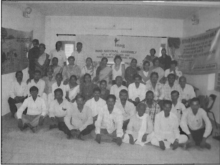
Assemblée générale de l'INAG, Kanyakumari, Inde - Octobre 2007